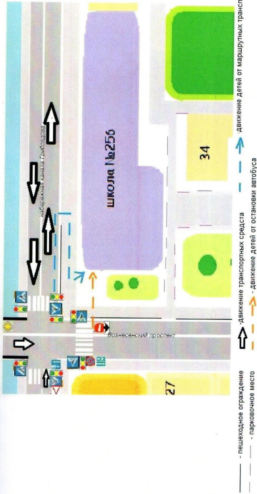
Схема организации дорожного движения в непосредственной близости от образовательного учреждения с размещением соответствующих технических средств, маршруты детей и расположение парковочных мест