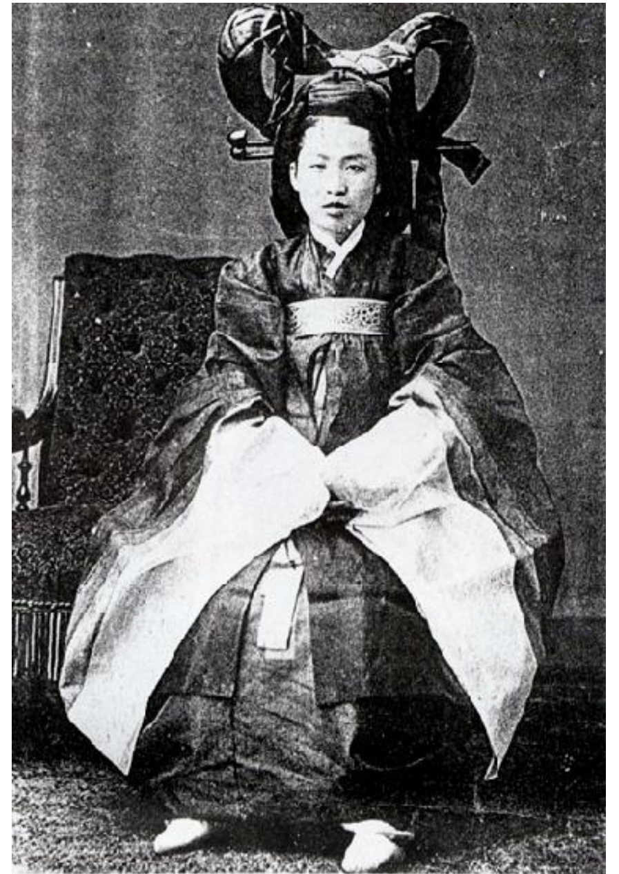
Dame du Palais. — Coiffure de cérémonie.

Ханбок произошел от одежды северосибирских кочевников — об их общем стиле одежды впервые стало известно, когда на севере Монголии было найдено захоронение хунну, племени, населявшего степи к северу от Китая в III веке до нашей эры.