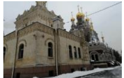
Подворье Свято-Троицкого Зеленецкого мужского монастыря. Кокина Ксения, 7 класс. Аудио тур