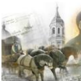
Во время эволюционных изменений