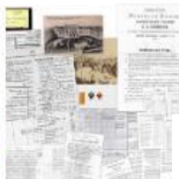
Олимпиада в Сочи