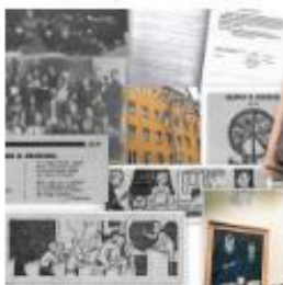
Самые чудные вещи